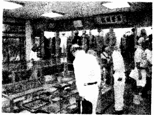
↑護国神社の戦争遺品館では多くの若者達の遺品が