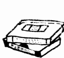
澤地講演会ビデオ (本 800円)