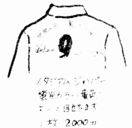
九条ジャンパー 紫黒カラー・前面 ロゴが目立ちます 1枚 2000円